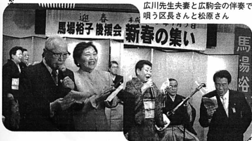
広川先生夫妻と広駒会の伴奏で 唄う区長さんと松原さん