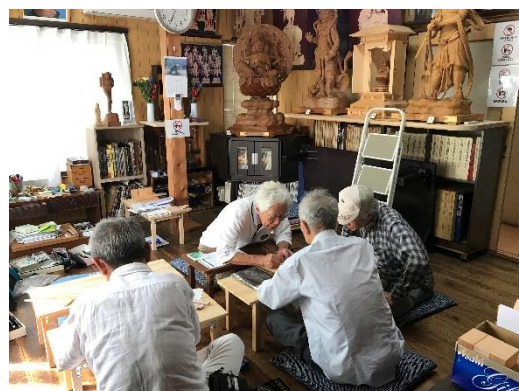
※写真：研鑽会（左上）、教室（右下）

毎月第2, 4土、日曜日は、記念館の開館日で、この日は、雅風会の研鑽会や教室の開催日でもあります。いつも朝早くから準備をして、館長ご夫妻が迎えてくださいます。