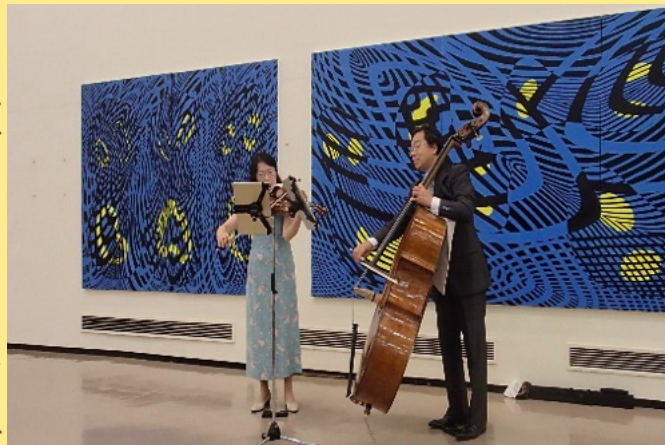
ビオラ・チェロの演奏(初日イベント)