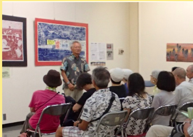
表現の自由についての討論会