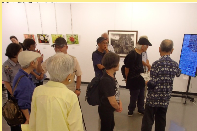
出品者が自作品の前で観客と交流(初日会場めぐり)