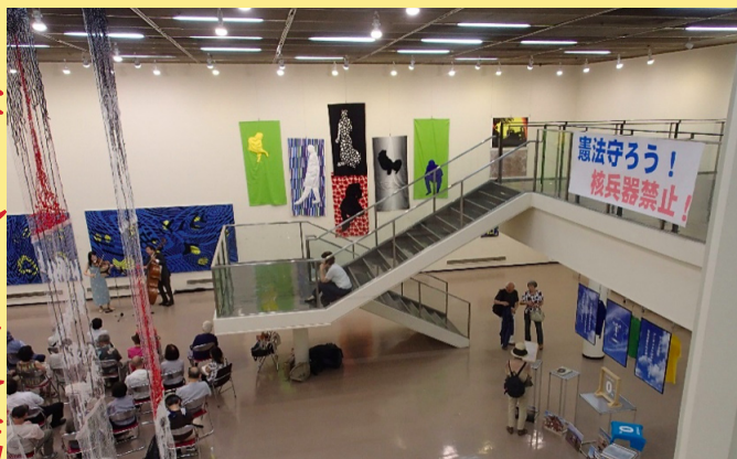
様々な作品を展示できる広い会場