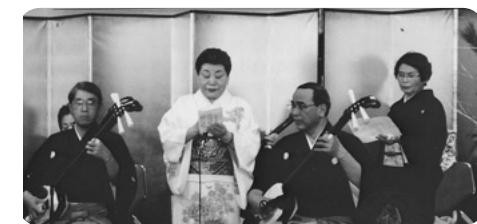
広川先生夫妻と広駒会の皆様