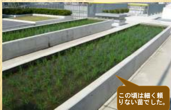
5月下旬 田植え直後