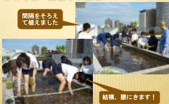
5月下旬 田植えの様子