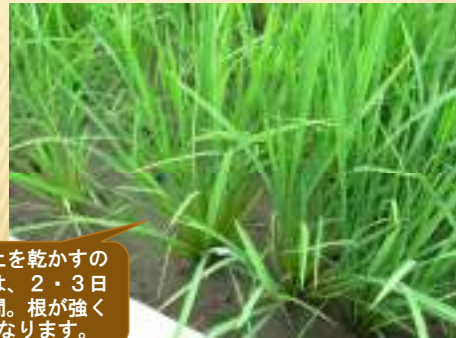
6月中旬 中抜きの様子