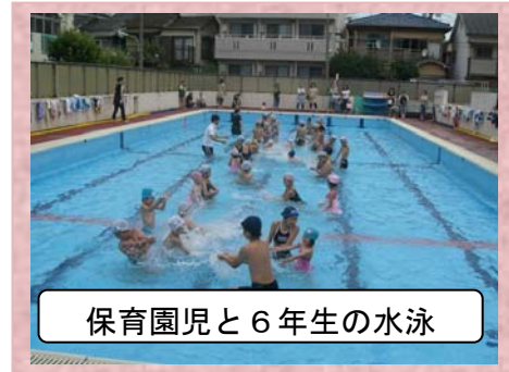
保育園児と6年生の水泳