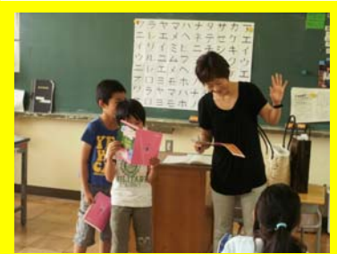
アナウンサー授業