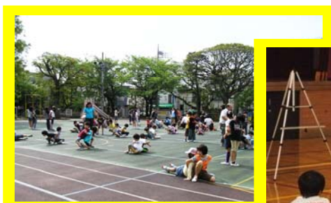
元気アップタイム