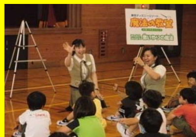
ディズニー魔法の教室